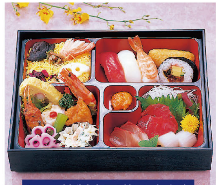
79 特製寿司幕の内(A) 2,000円 (税込2,160円)