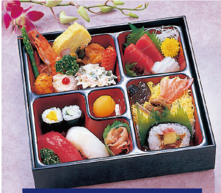
78 寿司幕の内(C) 1,650円 (税込1,782円)