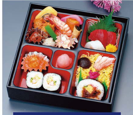
77 寿司幕の内(B) 1,500円 (税込1,620円)