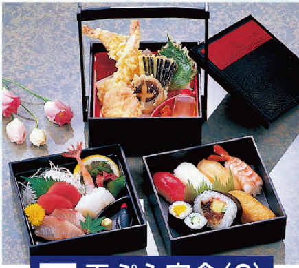
75 天ぷら定食(C) 2,100円 (税込2,268円)

◆季節のご馳走を最高の状態でお届けします。 ◆平日の10時～13時までは『茶碗蒸し』が付きまます。お寿司を要予約にて『白ご飯』にも変更できます。 ※さげ袋が必要な場合は、別途有料となります。