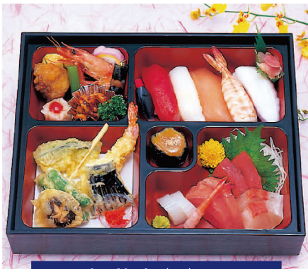
83 松花堂(B) (天ぷら入り) 2,500円 (税込2,700円)