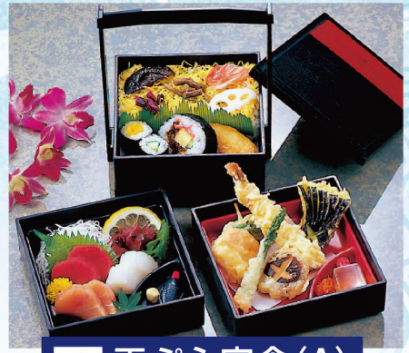
73 天ぷら定食(A) 1,650円 (税込1,782円)