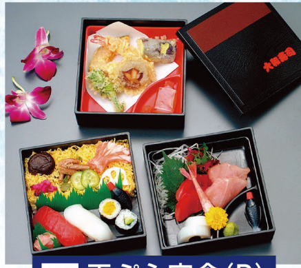
74 天ぷら定食(B) 1,850円 (税込1,998円)