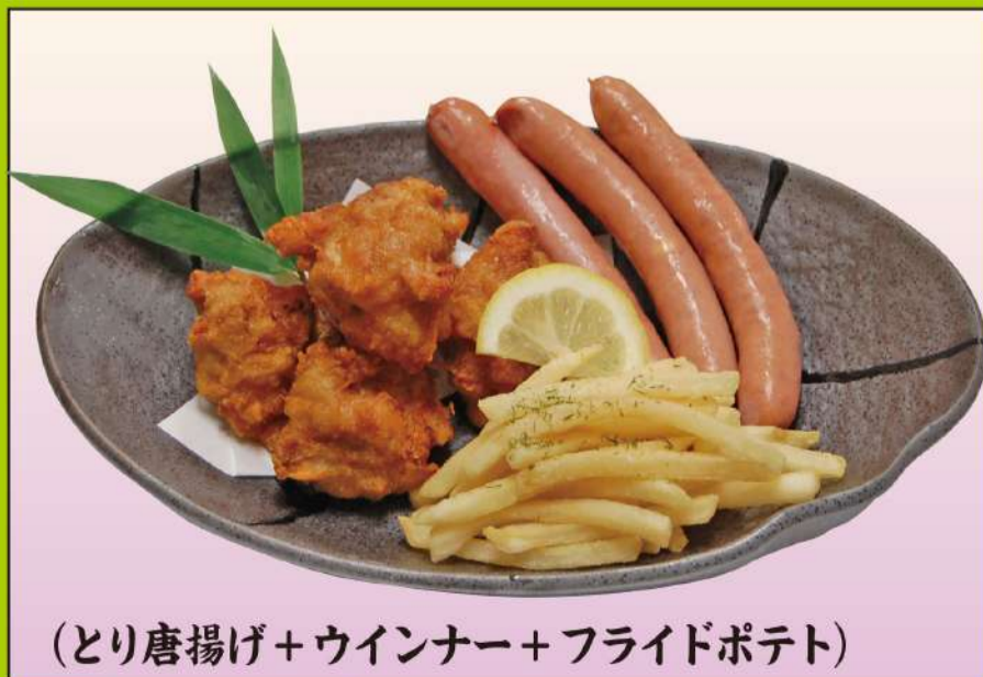
(とり唐揚げ+ウインナー+フライドポテト) ミックス盛合せ 1,200円(税込1,296円)