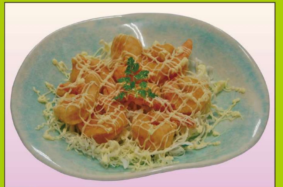
エビマヨ 1,200円(税込1,296円)