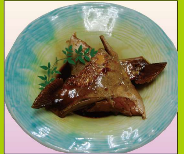
カンパチ煮 (ブリ) 600円(税込648円)