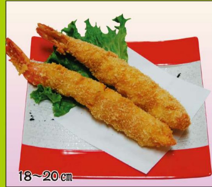
ジャンボエビフライ (2本) 1,400円(税込1,512円)