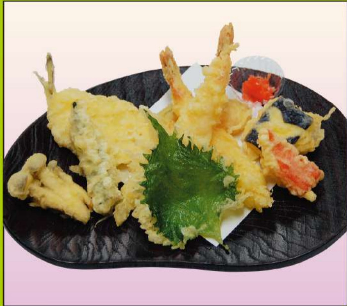
天ぷら盛合せ (1人前) 1,350円(税込1,458円)