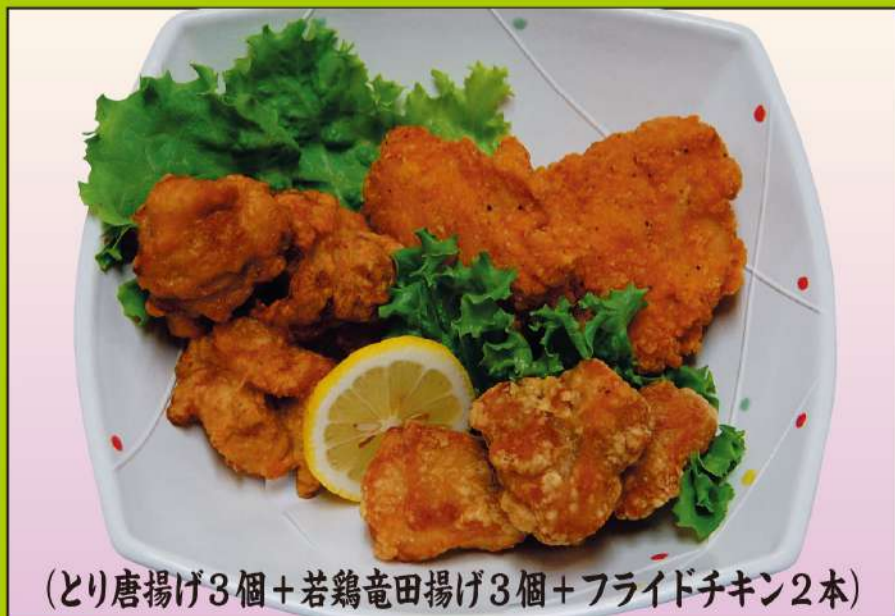
(とり唐揚げ3個+若鶏竜田揚げ3個+フライドチキン2本) チキンセット 1,200円(税込1,296円)