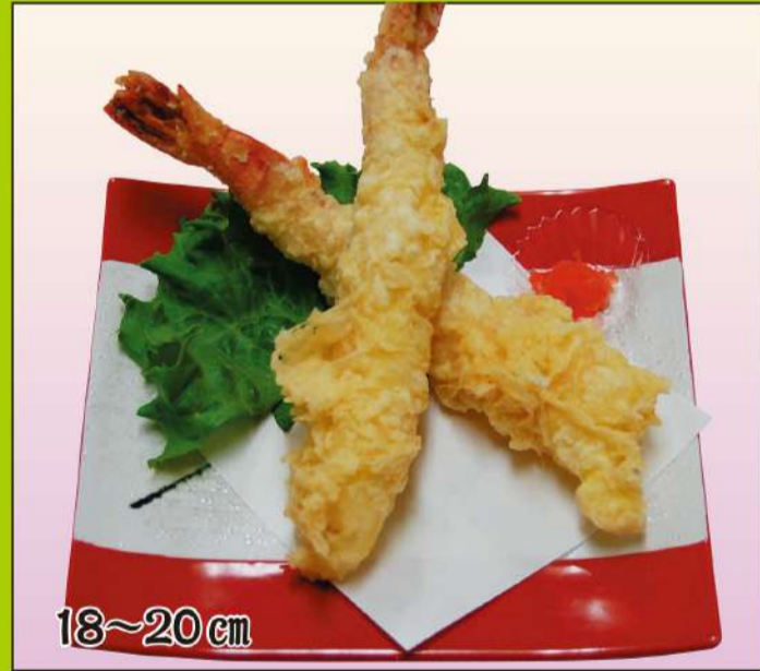
ジャンボエビ天ぷら (2本) 1,400円(税込1,512円)