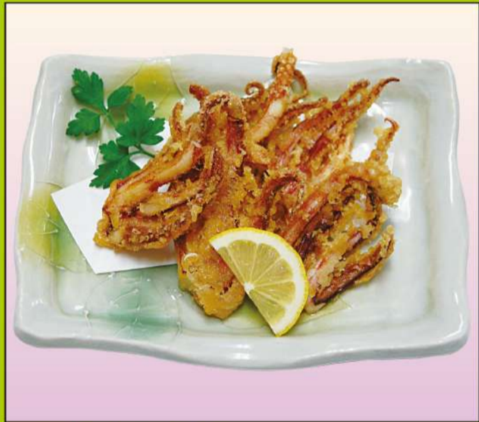
ゲソ唐揚げ 800円(税込864円)