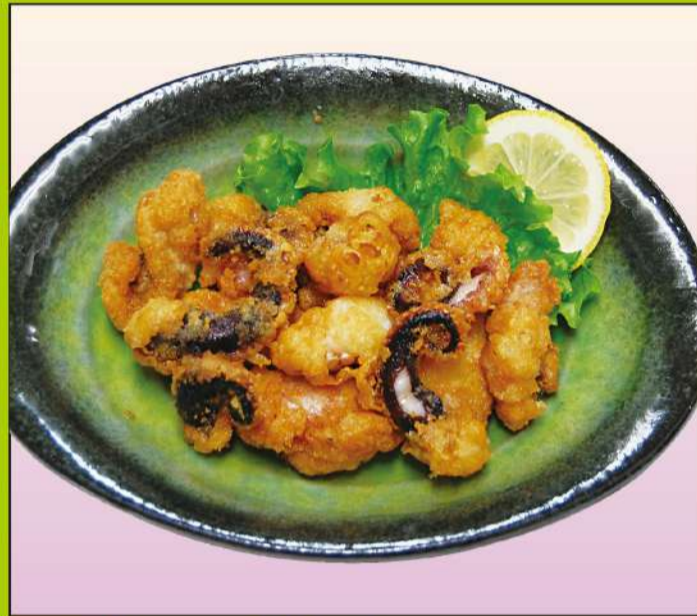
タコの唐揚げ 800円(税込864円)