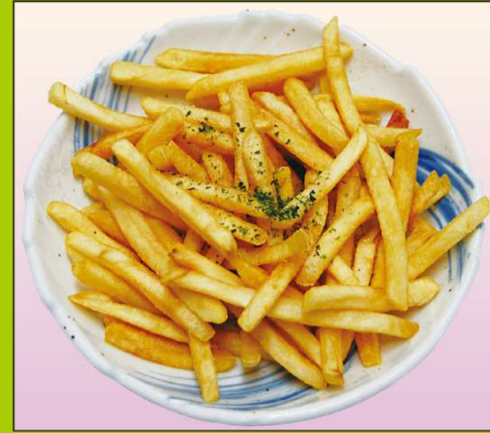
フライドポテト 600円(税込648円)