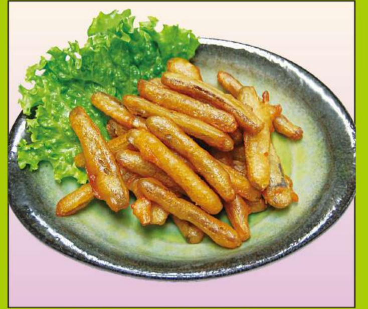
ゴボウの唐揚げ 600円(税込648円)