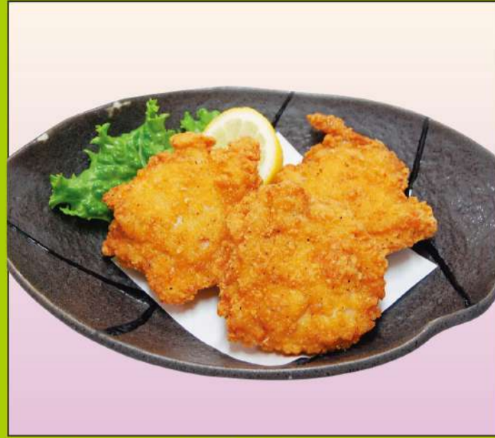
フライドチキン (3本) 650円(税込734円)