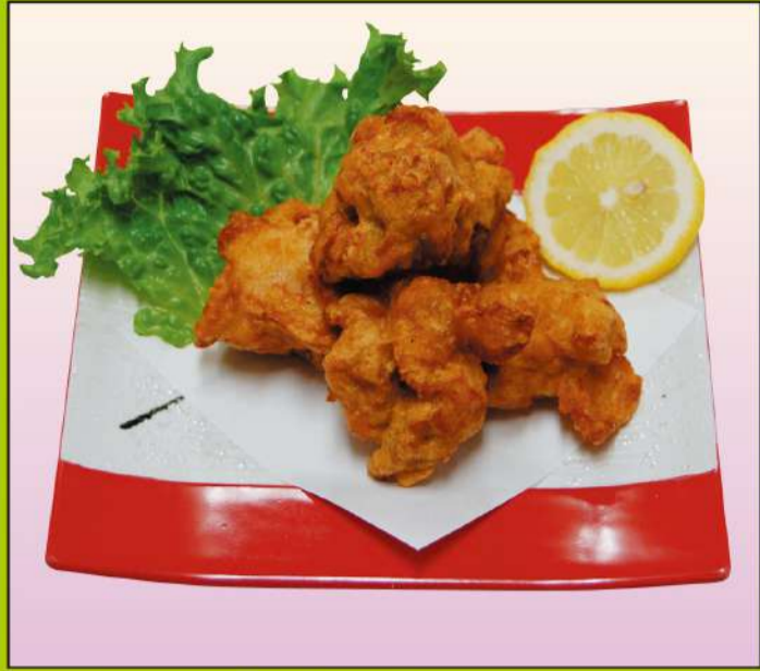
とり唐揚げ (5個) 680円(税込734円)