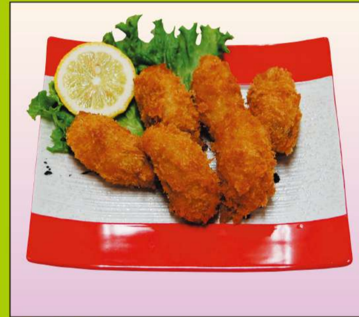
カキフライ (6個) 850円(税込918円)