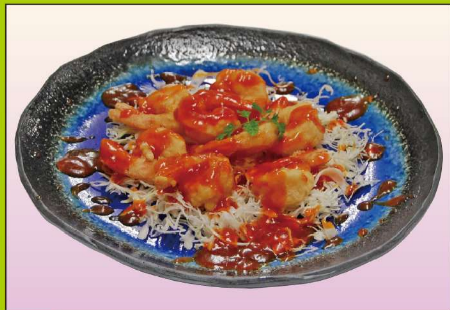
エビチリソース 1,200円(税込1,296円)