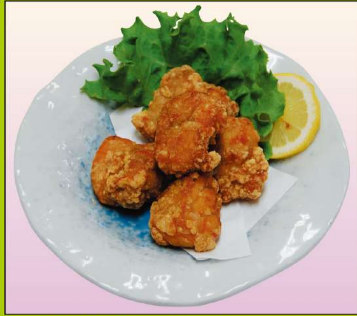
若鶏竜田揚げ (5個) 680円(税込734円)