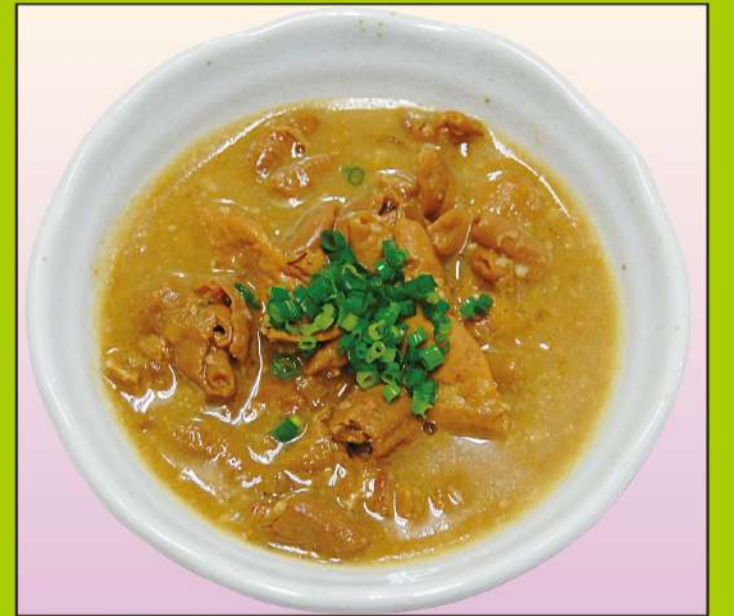
豚ホルモン 650円(税込702円)