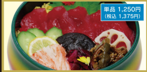
江戸前マグロちらし

梅竹 1,600円 (税込1,760円) ちらし定食 1,400円 (税込1,540円) ちらし天ぷら定食 1,450円 (税込1,595円)