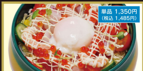
海鮮サラダちらし

梅竹 2,250円 (税込2,475円) ちらし定食 2,000円 (税込2,200円) ちらし天ぷら定食 2,050円 (税込2,255円)