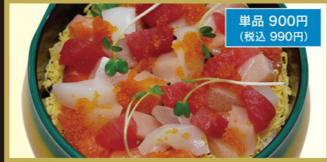
海鮮ちらし(とびっ子入り)

梅竹 1,550円 (税込1,705円) ちらし定食 1,300円 (税込1,430円) ちらし天ぷら定食 1,350円 (税込1,485円)