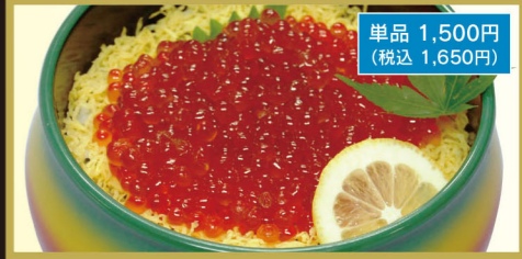
イクラちらし(イクラ80g)

梅竹 1,950円 (税込2,145円) ちらし定食 1,700円 (税込1,870円) ちらし天ぷら定食 1,750円 (税込1,925円)