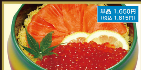
シャケ親子ちらし(イクラ30g)

梅竹 2,100円 (税込2,310円) ちらし定食 1,800円 (税込1,980円) ちらし天ぷら定食 1,850円 (税込2,035円)