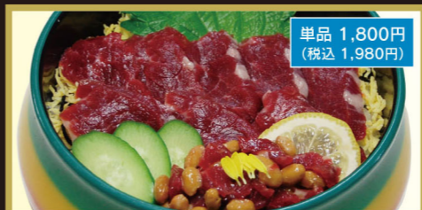
桜納豆馬刺ちらし

梅竹 2,100円 (税込2,310円) ちらし定食 1,800円 (税込1,980円) ちらし天ぷら定食 1,850円 (税込2,035円)