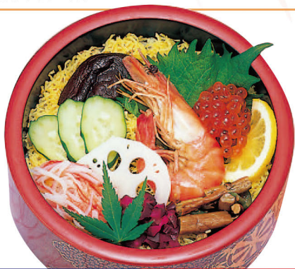
45 エビちらし 1,100円 (税込1,188円)