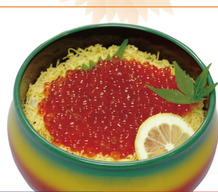
43 イクラちらし 1,800円 (税込1,944円)