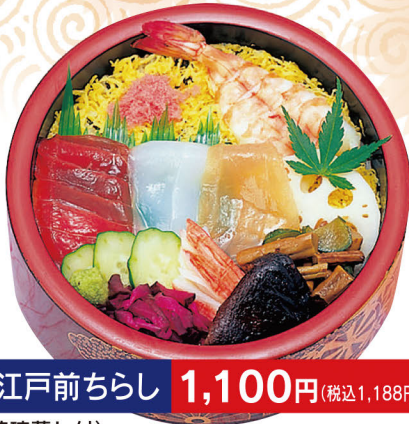
38 江戸前ちらし 1,100円 (税込1,188円)