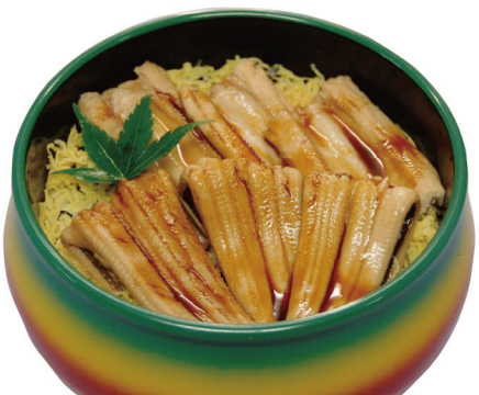
48 穴子ちらし 1,800円 (税込1,944円)