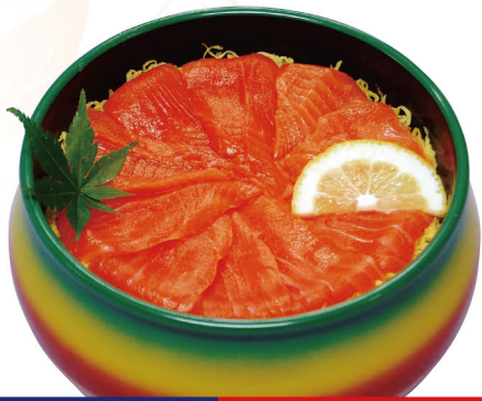
204 サーモン(鮭)ちらし 1,500円 (税込1,620円)