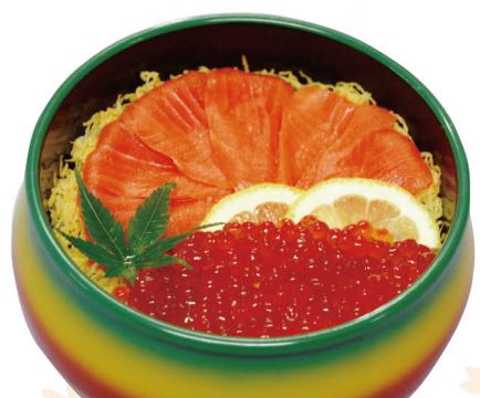
46 シャケ親子ちらし 1,800円 (税込1,944円)