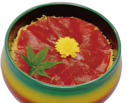
47 鉄火ちらし 1,800円 (税込1,944円)