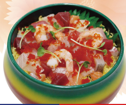
203 海鮮ちらし(A) 1,100円 (税込1,188円)