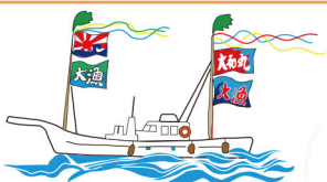
50 大漁 海鮮丼ちらし