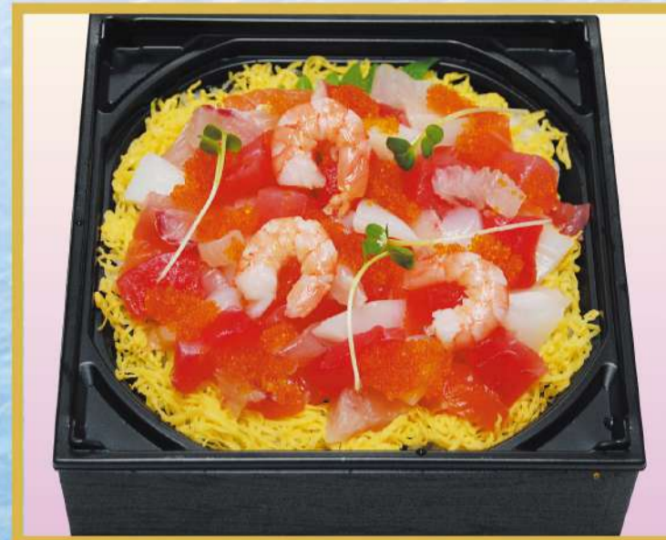
海鮮ちらし (とびっこ入り) 1,100円(税込1,188円)