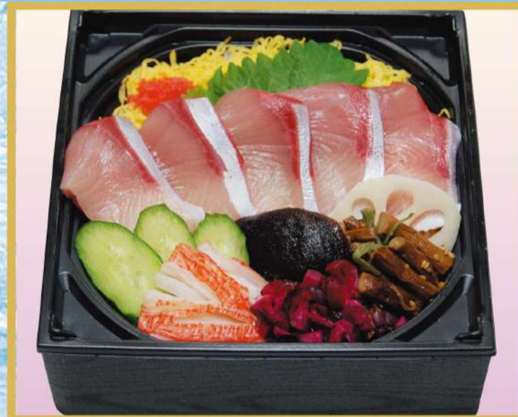
江戸前カンパチちらし 1,400円(税込1,512円)