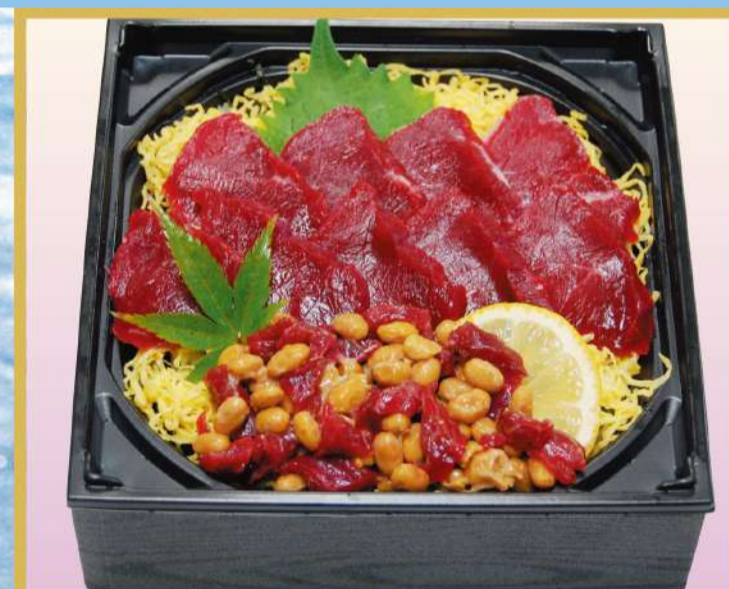
桜納豆馬刺ちらし 1,800円(税込1,944円)