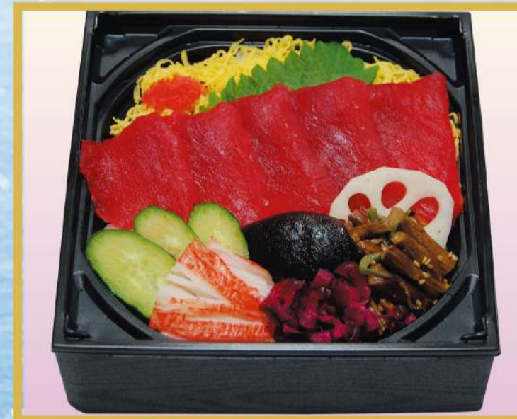
江戸前マグロちらし 1,500円(税込1,620円)