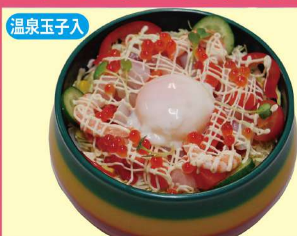
海鮮サラダちらし 1,500円(税込1,620円)