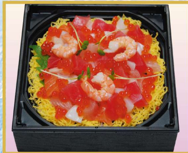
海鮮ちらし (イクラ入り) 1,500円(税込1,620円)