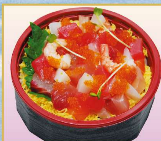
ミニ海鮮ちらし (とびっこ入) 700円(税込756円)