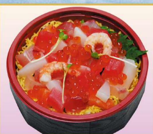
ミニ海鮮ちらし (イクラ入り) 1,000円(税込1,080円)