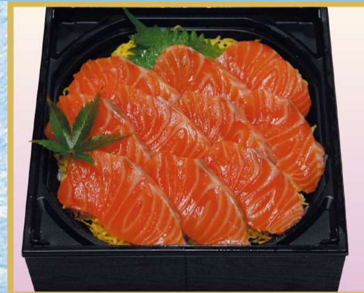
サーモンちらし 1,500円(税込1,620円)