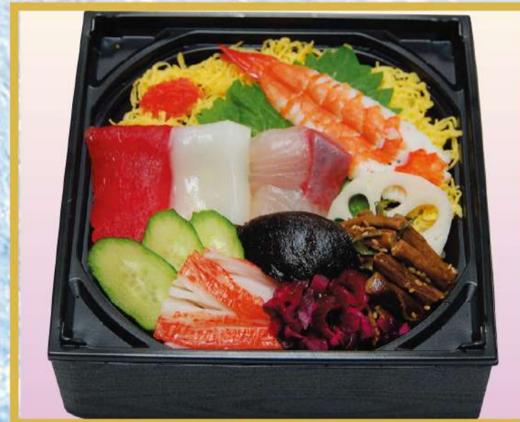
江戸前ちらし 1,100円(税込1,188円)