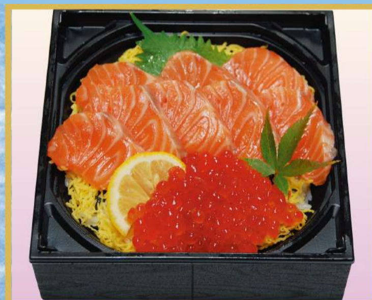
シャケ親子ちらし 1,800円(税込1,944円)