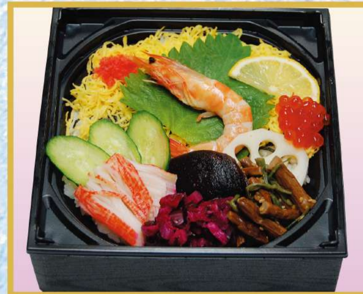
エビちらし (イクラ入り) 1,100円(税込1,188円)