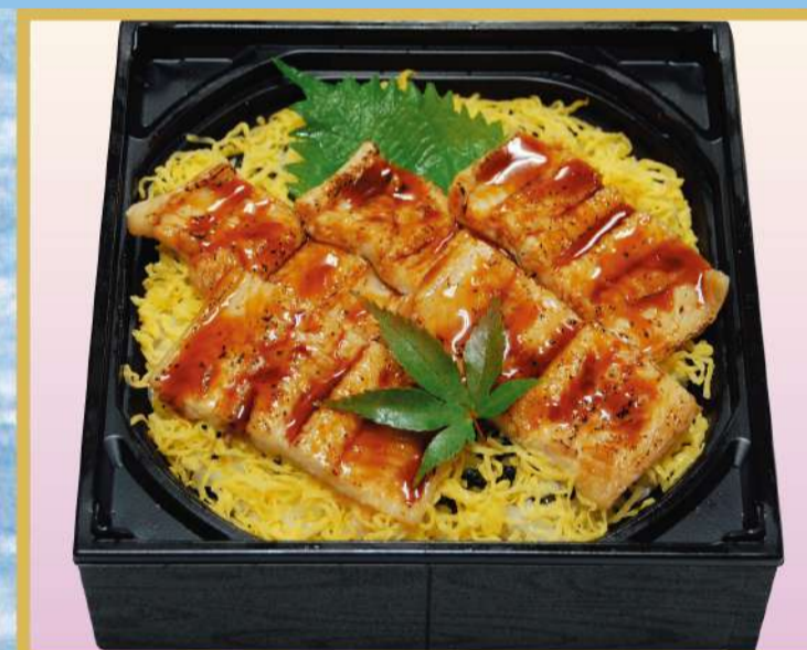
穴子ちらし 1,800円(税込1,944円)