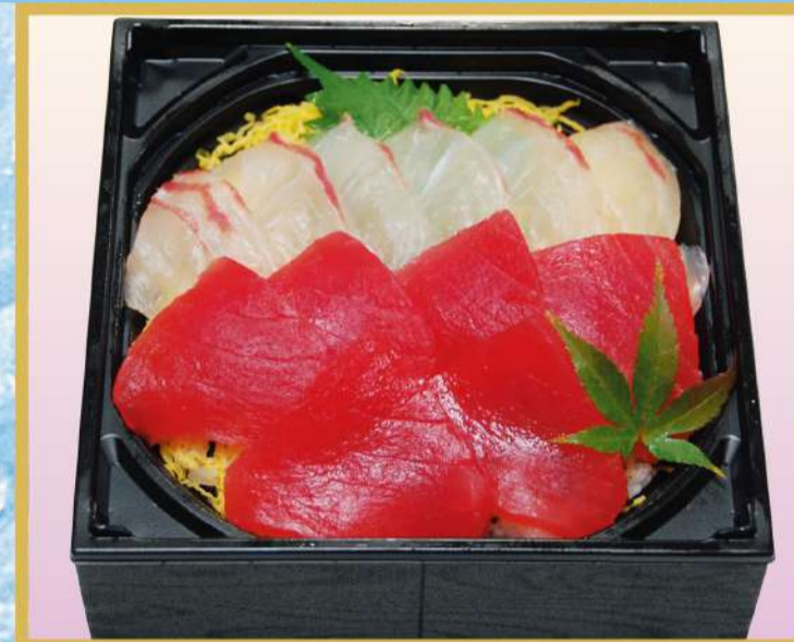
鯛マグロちらし たい 1,800円(税込1,944円)