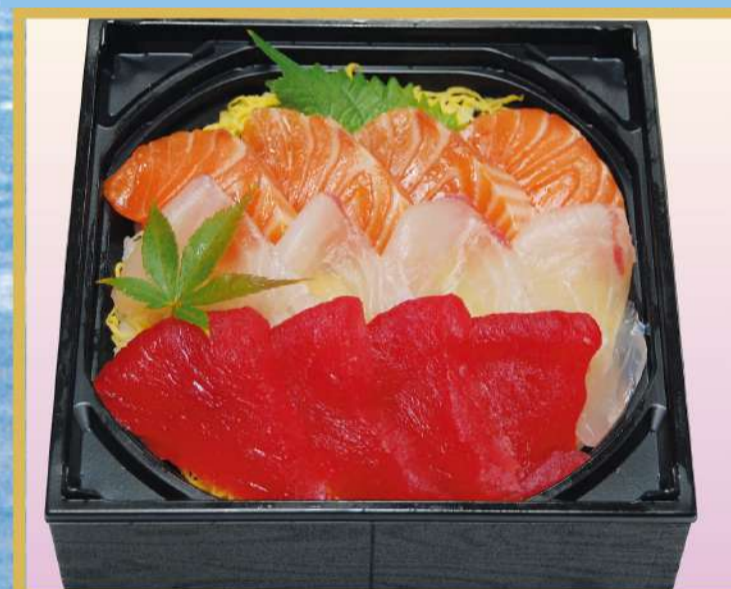
マグロ鯛鮭ちらし たいしゃげ 1,800円(税込1,944円)