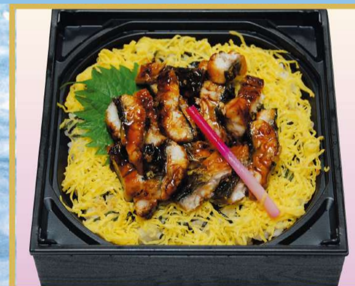
キザミうなぎちらし 1,800円(税込1,944円)