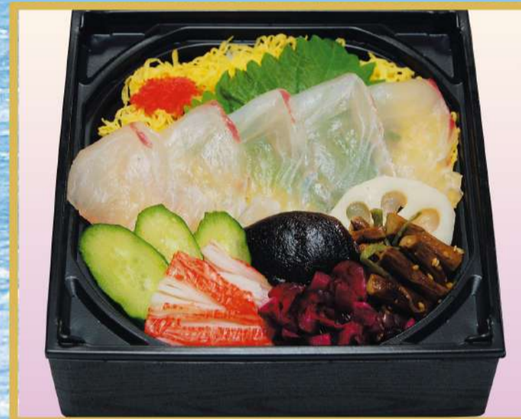
江戸前鯛ちらし たい 1,500円(税込1,620円)