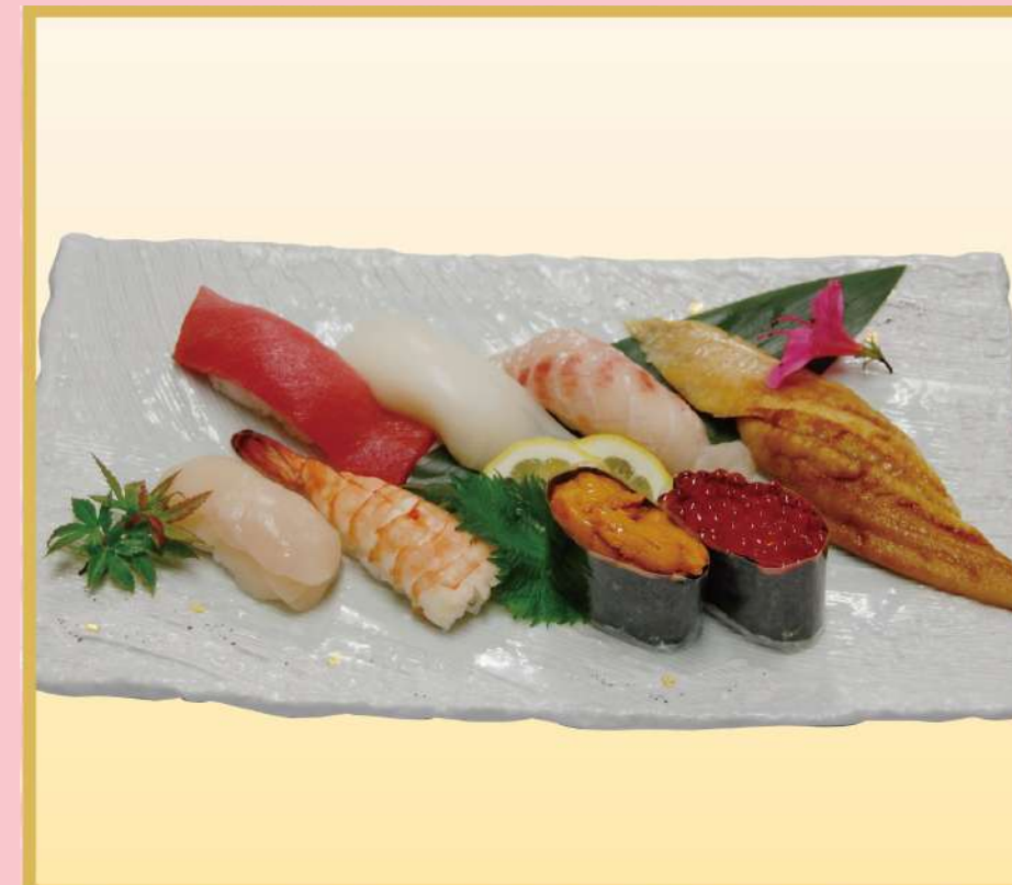
特上にぎり (A) (トロ入り) 3,500円(税込3,780円)