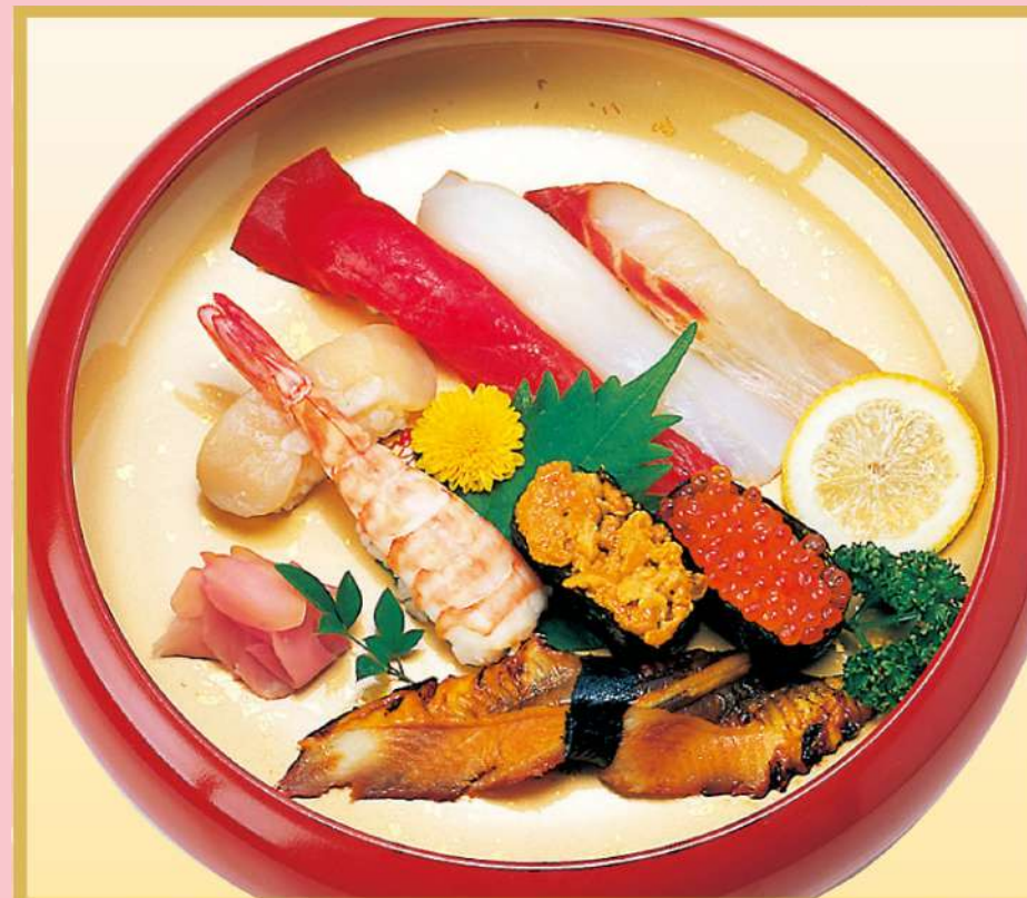
上にぎり (B) (ウニ、イクラ入り) 3,000円(税込3,240円)