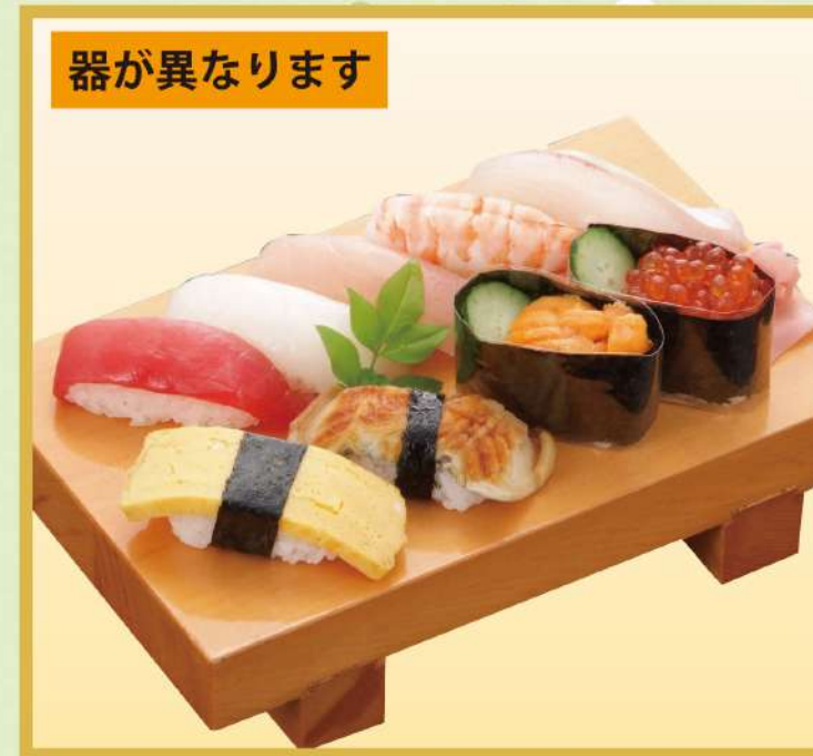
やまのにぎり (A) (9品、ウニ、イクラ入り) 2,000円(税込2,160円)