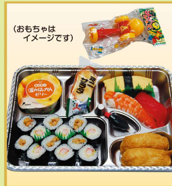
お子様寿司 (A) 1,000円(税込1,080円)