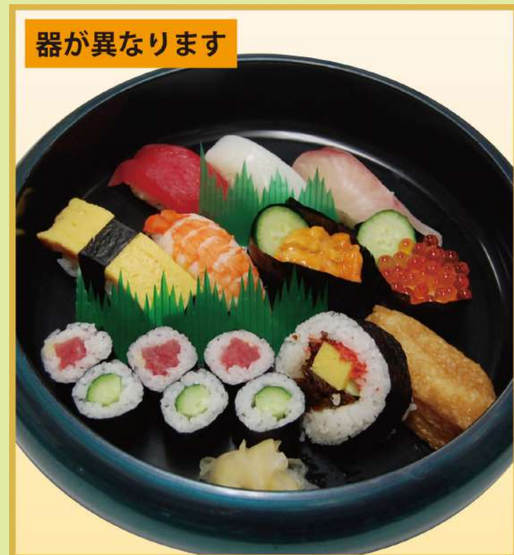
やまと盛合せ (B) (ウニ、イクラ入り) 1,800円(税込1,944円)