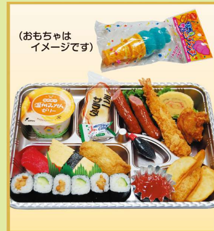
お子様寿司 (B) 1,200円(税込1,296円)