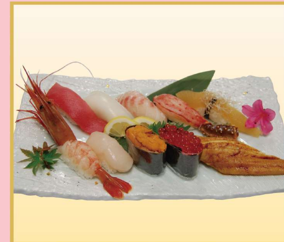
特上にぎり (B) (トロ入り) 5,000円(税込5,400円)