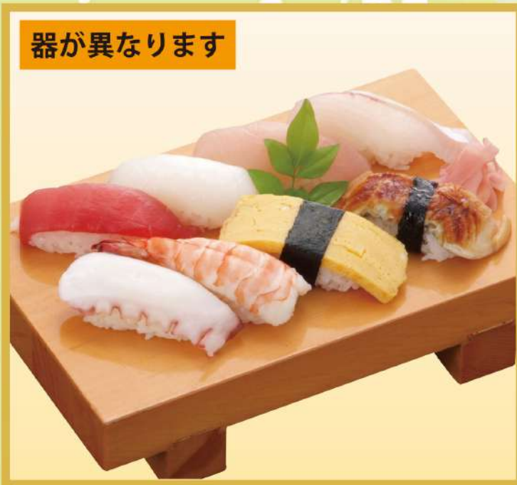
にぎり (A) (8品) 1,200円(税込1,296円)