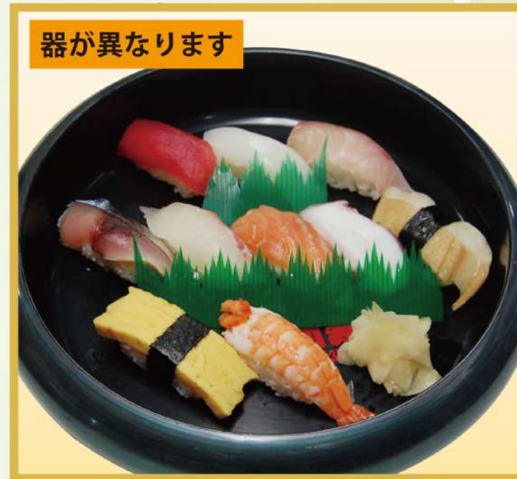
にぎり (C) (10品) 1,750円(税込1,890円)