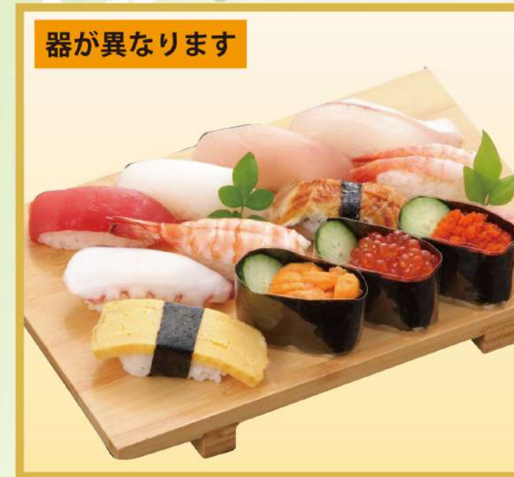
やまのにぎり (B) (12品、ウニ、イクラ、イソッ子入り) 2,800円(税込3,024円)