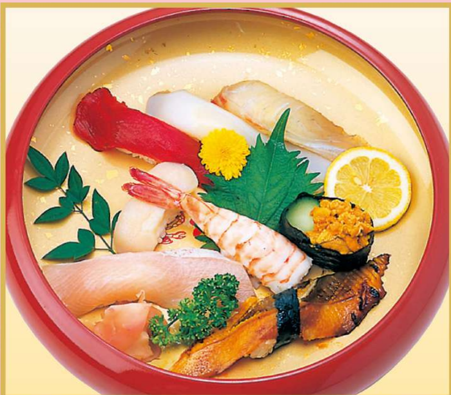
上にぎり (A) (ウニ入り) 2,600円(税込2,808円)