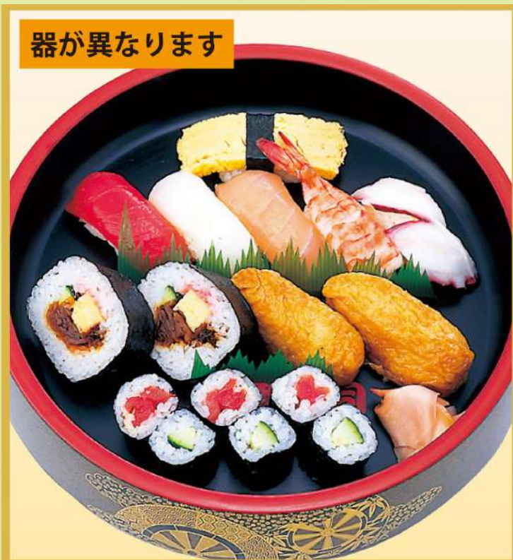
やまと盛合せ (A) 1,500円(税込1,620円)