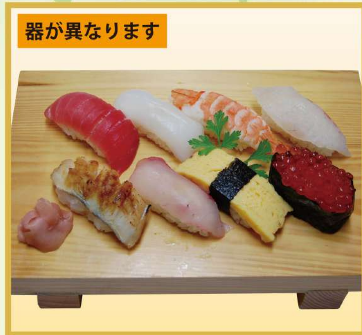
にぎり (B) (8品、イクラ入り) 1,500円(税込1,620円)